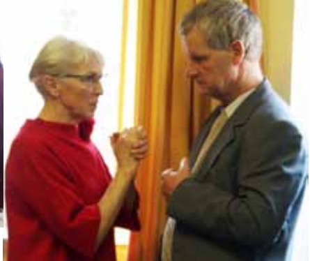
Impression vom Neujahrsempfang im Januar 2020