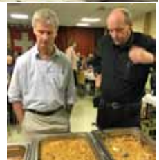
Impression vom DankeSchönAbend im November 2019 unter dem Motto „Schweiz“